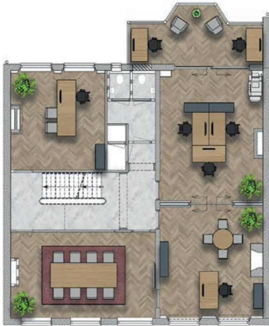
Zeestraat 62 EERSTE VERDIEPING