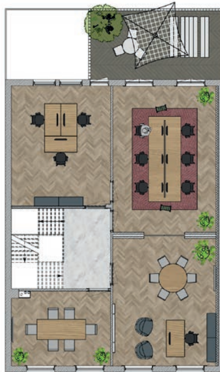
Zeestraat 66A EERSTE VERDIEPING