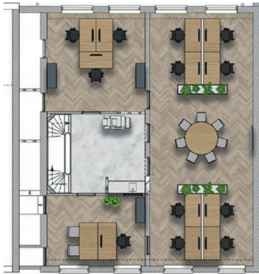
Zeestraat 66 EERSTE VERDIEPING