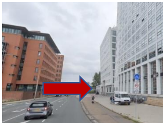
Ingang Regulusweg parkeergarage SDU

De ingang van de parkeergarage gemarkeerd 'SDU' kunt u inrijden om te parkeren. Hier kunt u aanbellen en zullen wij u binnen laten. Er zijn geen parkeerborden en u kunt een parkeerplek uitzoeken.